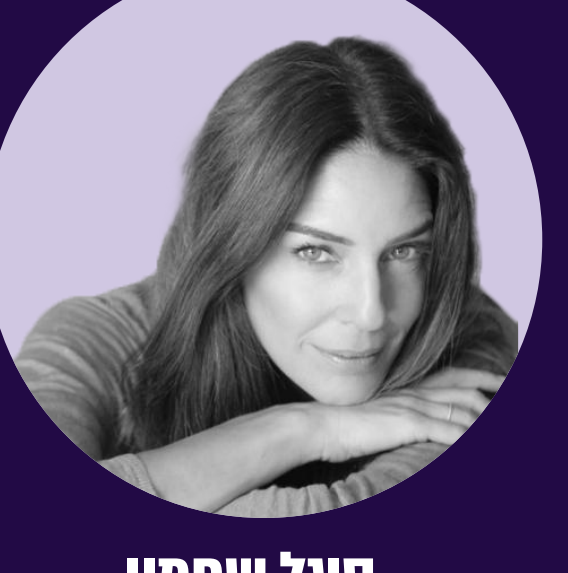
סיגל שחמון מגישת טלוויזיה, "מעצבת פנים ופנים" ומאמנת מנטלית