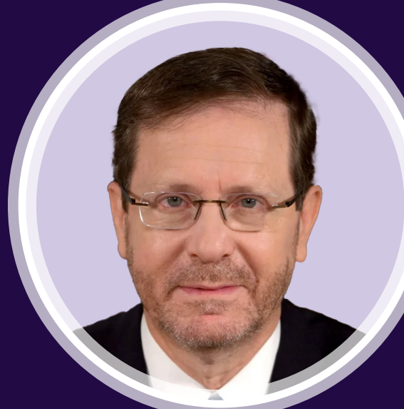
יצחק הרצוג נשיא מדינת ישראל