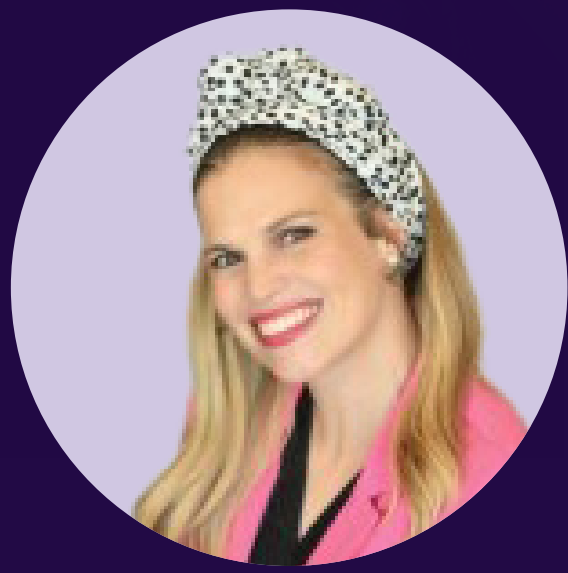
ד"ר אביעל בק יזמת סדרתית ומומחית למדעי המוח, ביוטכנולוגיה וטכנולוגיות בריאות מתקדמות